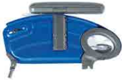
// LIF050109 Deskseiten- teile hochschwenkbar und abnehmbar