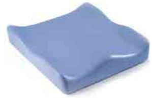
// JAY020003 JAY Soft Combi P Kissen (Bild zeigt Kissen ohne Bezug)