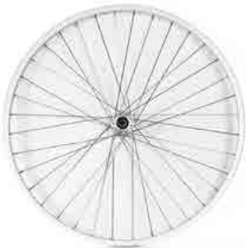
// LIF080317 Antriebsrad, Universal, 36 Speichen, kreuzförmig verspeicht