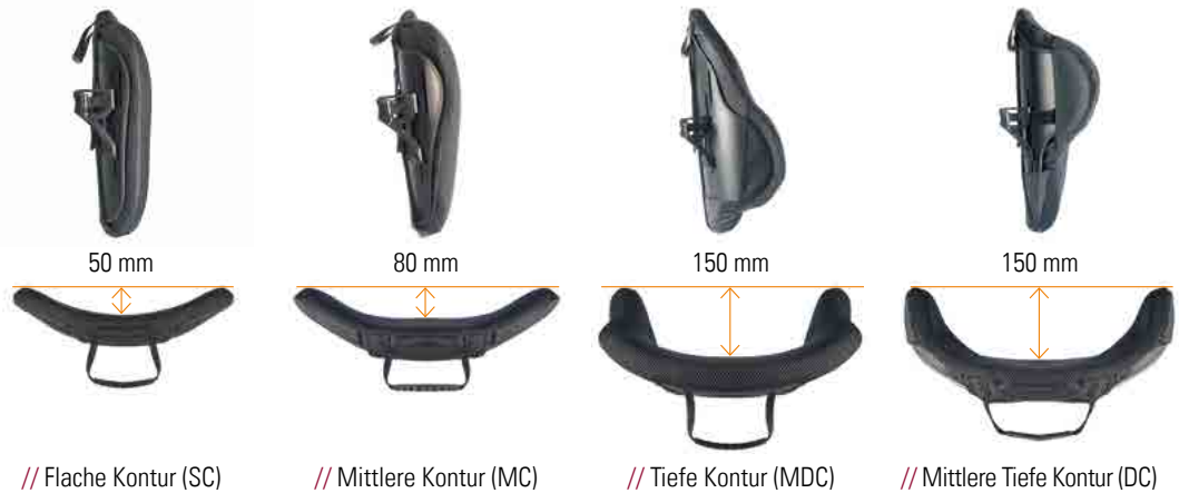
// Flache Kontur (SC)