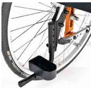
// LIF090001 Stockhalter, Schlaufe