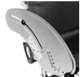
// LIF050114 Aluminium, Kälteschutz