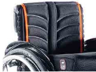
// LIF030317 EXO PRO Rückenbespannung