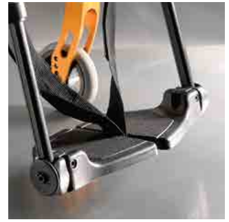
// LIF060191 Fußbrett, geteilt, Kunststoff