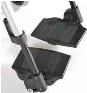
// LIF060192 Fußbrett, geteilt, Aluminium