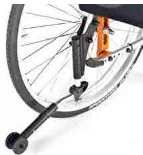
// LIF090123 Sicherheitsrad, ab- schwenkbar, links