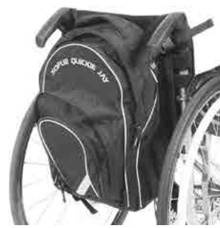
// LIF090009 Rucksack