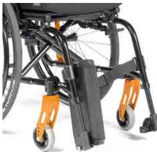
// Rahmen Easy Life FF