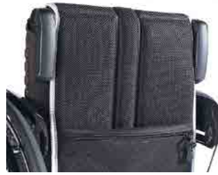
// LIF040040 Schiebegriffe abklappbar