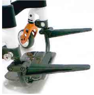
// LIF090000 Caddy, hochklappbarer Träger für Taschen