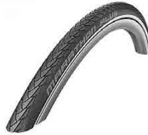
// LIF080513 Schwalbe Marathon Plus Evolution, pannengeschützt