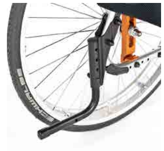
// LIF090006 Ankipfbügel, links