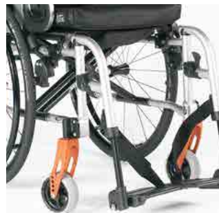
// Rahmen Easy Life SA