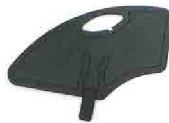
// LIF050112 Kunststoff, abnehmbar