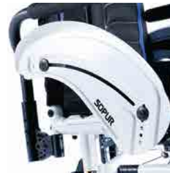
// LIF050115 Aluminium, Kleiderschutz, Kälteschutz