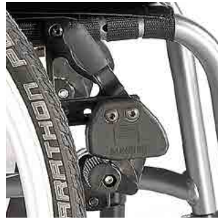
// LIF060002 Kniehebelbremse