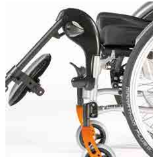
// LIF060007 Fußraste, Aluminium, hochschwenkbar