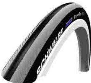
// LIF080500 Schwalbe Right Run Feinprofil