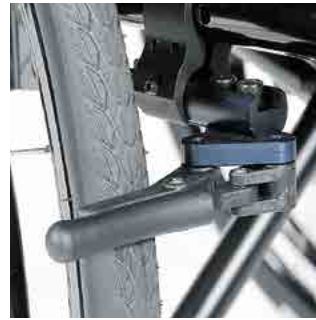
// LIF080804 Kompaktbremse