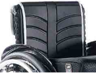
// LIF030316 EXO Rückenbespannung