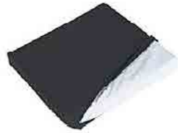
// Sitzkissen, Klimamembran mit Nässechutz, Bezug mit Reißverschluss, schwarz