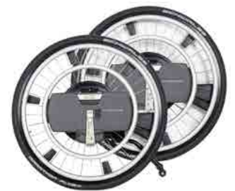
// WDO070201 WheelDrive