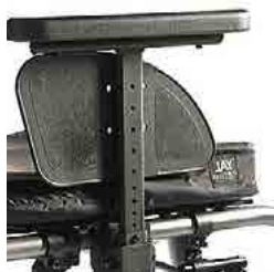
// LIF040052 Seitenteil Zentralstütze, Armpolster, tiefen- und höhenverstellbar