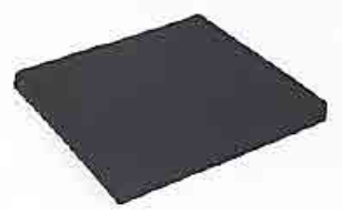
// Sitzkissen, Bezug mit Reißverschluss, schwarz