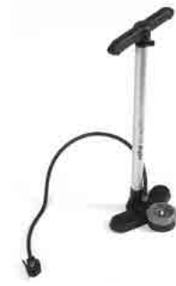
// LIF090024 Standpumpe, Hochdruck