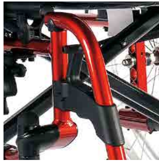
// LIF050004 Fußbretthalter Kunststoff 100°