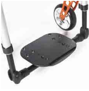
// LIF050032 Leichtbau-Fußbrett durchgehend, winkleinstellbar Kunststoff, hochklappbar