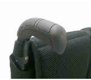
// LIF040018 Schiebegriff, lang