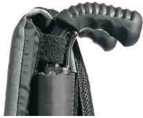
// LIF040038 Kurze Griffe (nicht in Kombination mit Trommelbremse)