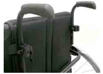
// LIF040041 Schiebegriffe höhenverstellbar