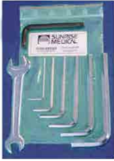
// LIF090005 Werkzeugsatz