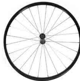
// LIF080310 Antriebsrad, Leichtgewicht, 24 Speichen, gerade verspeicht