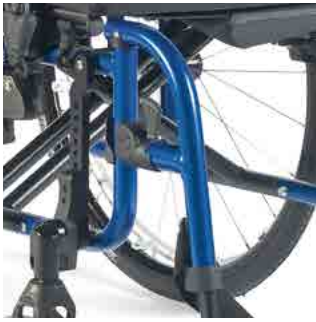
// LIF050007 Fußbretthalter Aluminium 100°