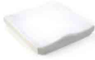
// JAY020002 JAY Basic Kissen (Bild zeigt Kissen ohne Bezug)