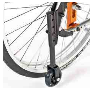
// LIF090115 Transitrollen