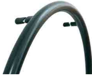
// LIF080661 Supergrip