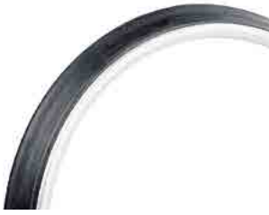
// LIF070208 Max Grepp