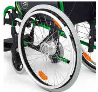
// LIF080807 Trommelbremse, 36 Speichen, kreuzförmig verspeicht