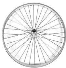
// LIF080309 Antriebsrad, Design, 36 Speichen, gerade verspeicht