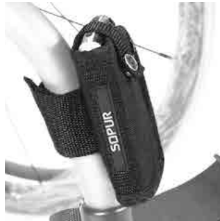
// LIF090010 Handytasche