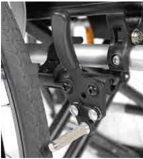
// LIF080700 Druckbremse