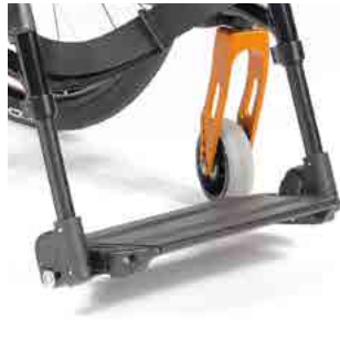
// LIF060193 Fußbrett, durchgehend Aluminium