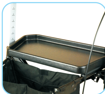
Tablett & Sitz mit Klettverschluss Art. Nr.: ACR01005VS