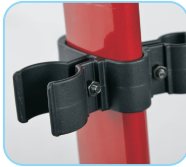
Stockhalter Art. Nr.: ACR01012