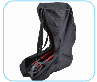
Transporttasche Art. Nr.: ACR01003