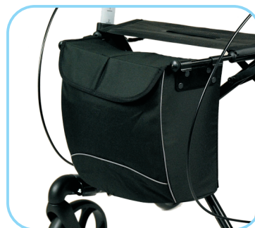
Tasche mit Abdeckung schwarz Art. Nr.: ACR01004C