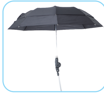
Regenschirm Art Nr.: ACR01014