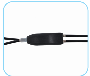
Einhandbremse (L, M, S) für Rollator Art. Nr.: ACR01001L, ACR01001M, ACR01001S Einhandbremse für Navigator Art. Nr.: ACR01001N