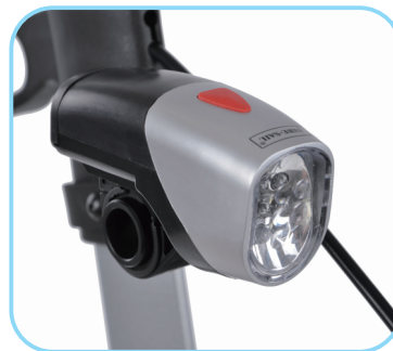
LED-Lampe Art. Nr.: ACR01010