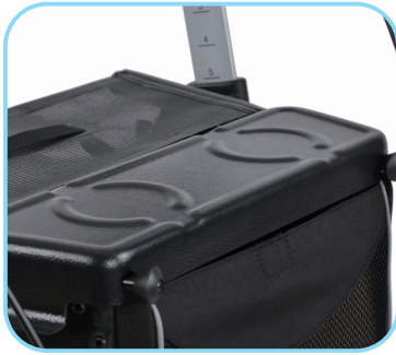
Kleines Tablett Art. Nr.: ACR01011