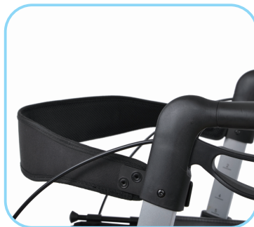
Rückengurt (850mm, 750mm, 700mm) Art. Nr.: ACR01009XL, ACR01009L, ACR01009M