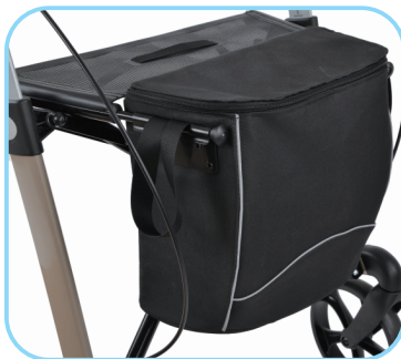
Wasserfeste Einkaufstasche Art. Nr.: ACR01004