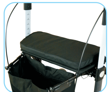
Fester Sitz mit Polsterung Art. Nr.: ACR01021