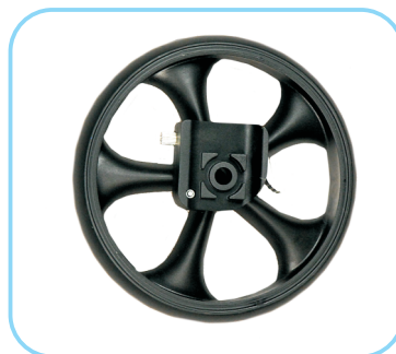
Schleppbremse 2 Räder Set Art. Nr.: ACR01025