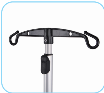
Infusionshalter Art. Nr.: ACR01002