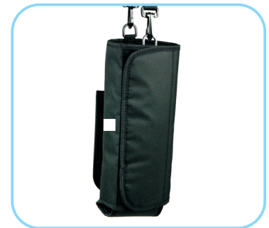
Sauerstoffflaschenhalter Art. Nr.: ACR01008