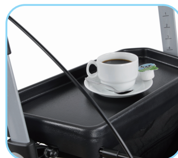
Grosses Tablett Art. Nr.: ACR01005