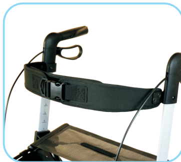
Verstellbarer Rückengurt Art. Nr.: ACR01009A